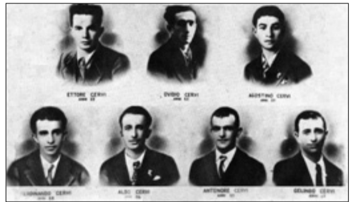
I sette fratelli Cervi

Occorre dire anche che il Pci (di Spezia) inviò immediatamente un ispettore per fare luce sul